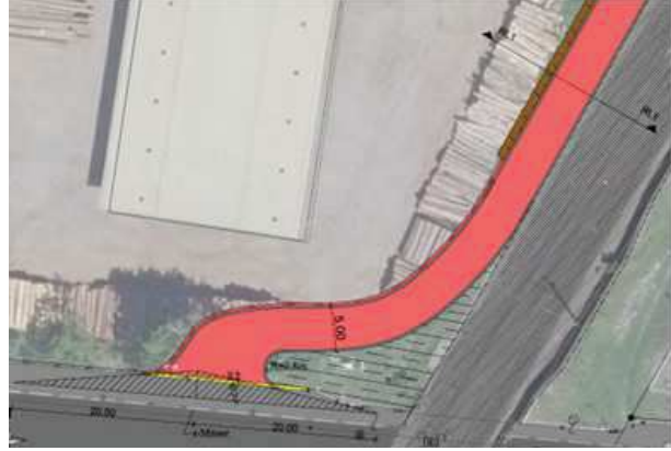
Lageplan Anbindung Montlinger Straße